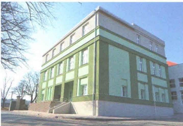
Zubní ordinace v přízemí budovy