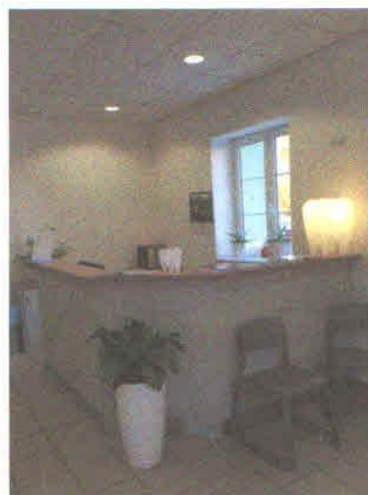
Recepce pro příjem pacientů